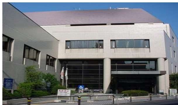
梅田地域学習センター正面玄関